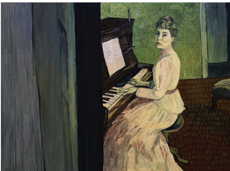
Fig. 7. Dorota Kobiela y Hugh Welchman, Loving Vincent , 2017. Género: ficción. Fotograma digital, Polonia y Reino Unido: BreakThru Productions, Trademark Films.