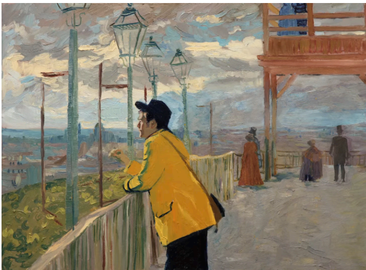
Fig. 5. Dorota Kobiela y Hugh Welchman, Loving Vincent , 2017. Género: ficción. Fotograma digital, Polonia y Reino Unido: BreakThru Productions, Trademark Films.

Como también demuestran las imágenes previas, las pinturas fueron recreadas incluso si los encuadres eran verticales en las versiones originales. Así, elementos adicionales fueron agregados a las pinturas, para adaptar los cuadros al formato de cine, que es horizontal.