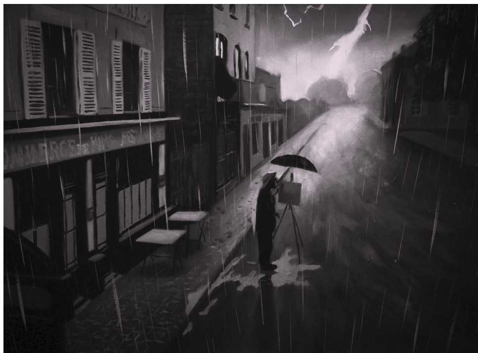
Fig. 1. Las secuencias de la película en escala de grises ocurren durante flashbacks subjetivos. Dorota Kobiela y Hugh Welchman, Loving Vincent , 2017. Género: ficción. Fotograma digital, Polonia y Reino Unido: BreakThru Productions, Trademark Films.

aquél son representadas en color, al estilo de las pinturas de Van Gogh; y las que ocurren en el segundo lucen como pinturas en escala de grises.