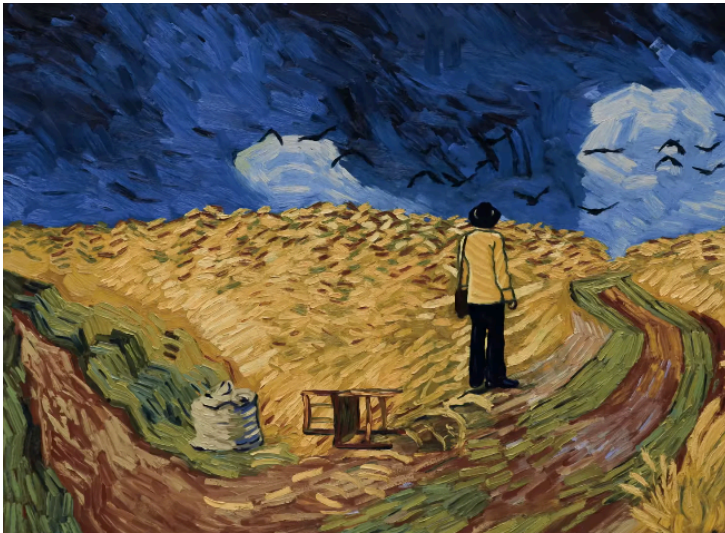
Fig. 14. Dorota Kobiela y Hugh Welchman, Loving Vincent , 2017. Género: ficción. Fotograma digital, Polonia y Reino Unido: BreakThru Productions, Trademark Films.