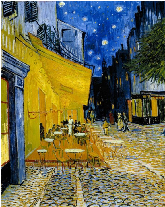
Fig. 8. Vincent van Gogh, Terraza de café por la noche , 1888. Óleo sobre lienzo. 81 x 65.5 cm. Kröller-Müller Museum, Países Bajos.

El formato no fue modificado en el caso de todas las pinturas, puesto que Terraza de café por la noche es acomodada en su forma original. En la recreación de la película, se muestra en un plano general que comienza en la parte superior de la pintura, y desciende con un travelling vertical para ubicar a los personajes en el famoso café.