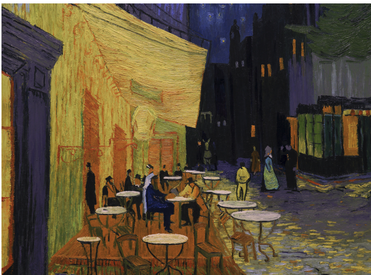
Fig. 9. Fotograma en el que concluye el travelling vertical en la película. Dorota Kobiela y Hugh Welchman, Loving Vincent , 2017. Género: ficción. Fotograma digital, Polonia y Reino Unido: BreakThru Productions, Trademark Films.