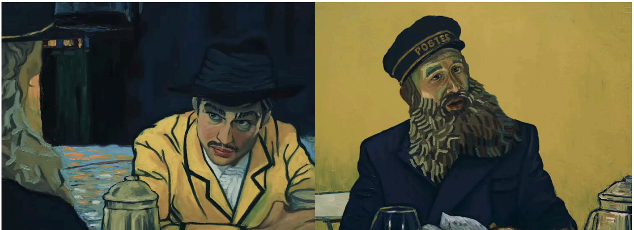
Fig. 15. Fotogramas de una secuencia al inicio de Cartas de Van Gogh , en la que Armand y su padre, el cartero Joseph Roulin, dialogan sobre Vincent. Nótese cómo el plano medio del segundo fotograma mantiene su parecido en colores y encuadre con el antes citado retrato del cartero.

Dorota Kobiela y Hugh Welchman, Loving Vincent , 2017. Género: ficción. Fotograma digital, Polonia y Reino Unido: BreakThru Productions, Trademark Films.