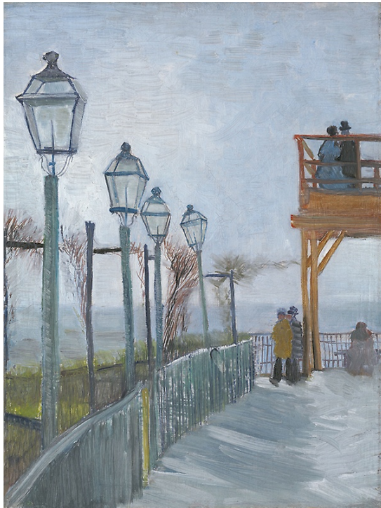
Fig. 4. Vincent van Gogh, Terraza y observatorio en el molino de Blute-Fin , 1887. Óleo sobre lienzo. 43.6 x 33 cm. Helen Birch Bartlett Memorial Collection, Art Institute of Chicago, Estados Unidos.