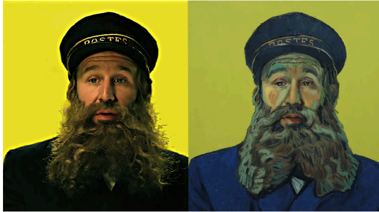
Fig. 2. Fotografía del actor Chris O'Dowd caracterizado como el cartero Joseph Roulin en el set de Cartas de Van Gogh , junto a un fotograma de la película terminada. Dorota Kobiela y Hugh Welchman, Loving Vincent , 2017. Género: ficción. Fotograma digital, Polonia y Reino Unido: BreakThru Productions, Trademark Films.