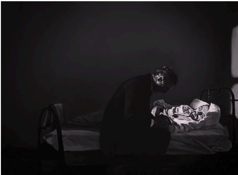
Fig. 16. Dorota Kobiela y Hugh Welchman, Loving Vincent , 2017. Género: ficción. Fotograma digital, Polonia y Reino Unido: BreakThru Productions, Trademark Films.

Los flashbacks , desde el punto de vista de los múltiples narradores no fiables, hacen uso de movimientos y recursos como cámara en mano en ciertas instancias 17 , el claroscuro para brindar una sensación sombría y de aislamiento (figura 16), y una variedad de planos que no están limitados por las composiciones de las pinturas de Van Gogh que homenajea la película. Los flashbacks presentan un estilo expresionista, pues retratan a Vincent como una persona desequilibrada y triste a través de la inestabilidad de la imagen. Es paradójico, entonces, que la expresión de la subjetividad en pintores como él haya dado pie a la vanguardia del Expresionismo años más tarde 18 .