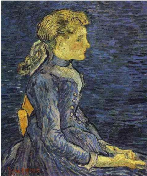
Fig. 10. Vincent van Gogh, Retrato de Adeline Ravoux , 1890. Óleo sobre lienzo. 67 x 55 cm. Colección privada, Suiza.

Madeline Ravoux, retratada por Van Gogh en varias instancias, e interpretada en la película por Eleanor Tomlinson en escenas de día y de noche: