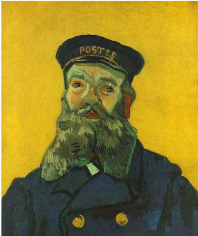
Fig. 3. Vincent van Gogh, Retrato del cartero Joseph Roulin , 1888. Óleo sobre lienzo. 65 x 54 cm. Kunstmuseum Winterthur, Suiza.

Así, la creación del filme implica una variante de la animación tradicional, en la que el dibujante recrea la sensación de movimiento en la imagen con variaciones en los dibujos, cada uno de los que es fotografiado para crear los fotogramas de película 12 . Cartas de Van Gogh utiliza una variación digital de la